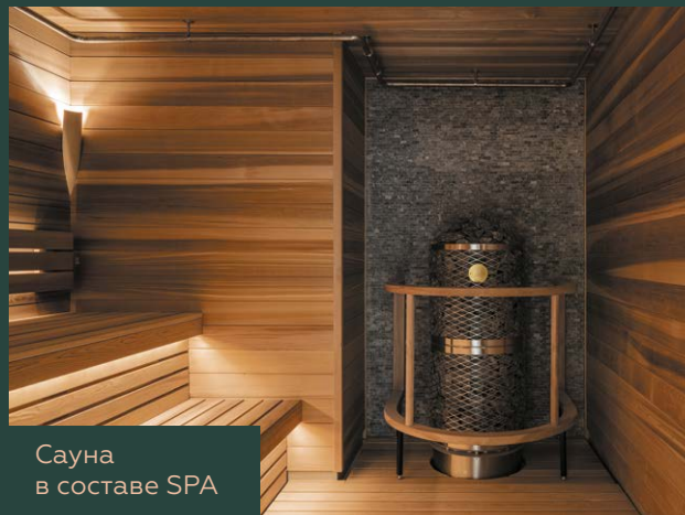
Сауна в составе SPA