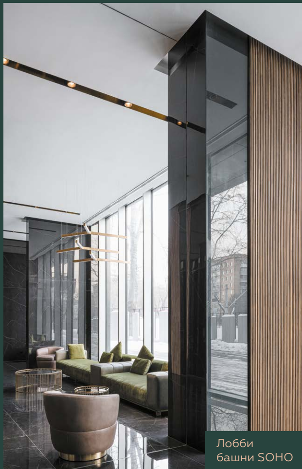
Лобби башни SOHO

Клубный дом бизнес-класса SOHO + NOHO – это комплекс апартаментов с продуманными планировочными решениями и чистой дизайнерской отделкой. Для жителей будут доступны 1000 м2 клубной инфраструктуры, где расположатся фитнес-зал, SPA с хаммам, сауной и джакузи, пространство для работы и вечеринок, а также игровая комната для детей.