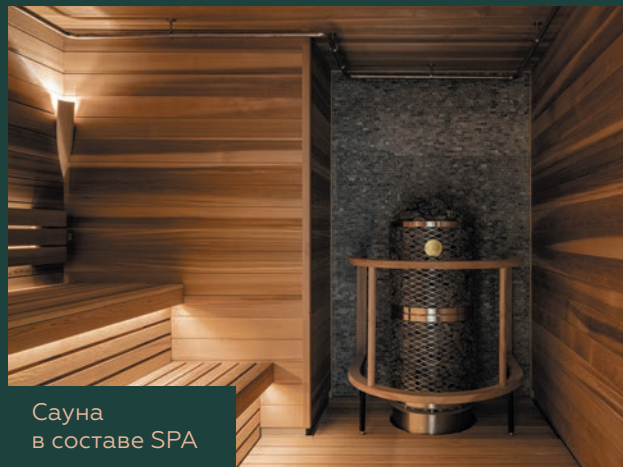
Сауна в составе SPA