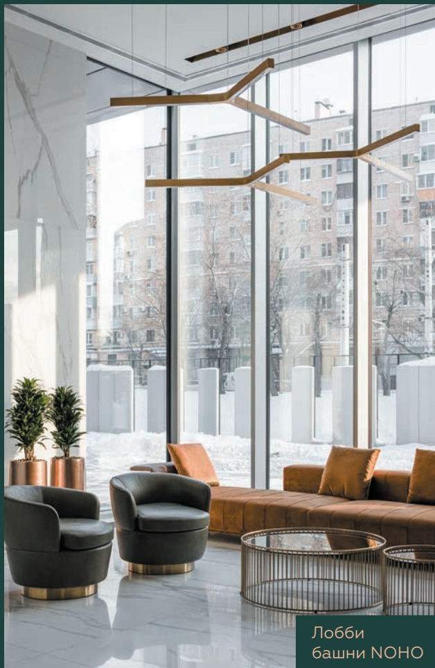
Лобби башни NOHO

Клубный дом бизнес-класса SOHO + NOHO – это комплекс апартаментов с продуманными планировочными решениями и чистой дизайнерской отделкой. Для жителей будут доступны 1000 м2 клубной инфраструктуры, где расположатся фитнес-зал, SPA с хаммам, сауной и джакузи, пространство для работы и вечеринок, а также игровая комната для детей.